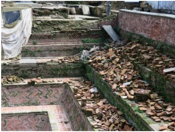
世界遺産カトマンズダブルスクエアで崩れ落ちた煉瓦の沐浴場