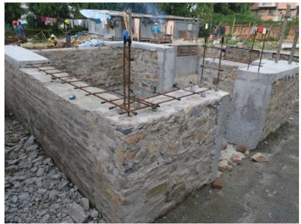
JICAによりトリブバン大学内に構築されている永住も可能な転居用モデルハウス