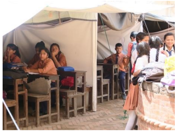
ダブルスクエアで学校のビルが使用できずにテントのなかで勉強する高校生