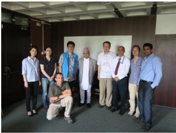
幸いにもネパール保健省大臣（中央）と面会できました。感染症やメンタルヘルスに対する今後のとりくみについて伺いました。