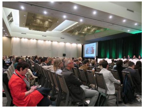
熱心に聴講する 60 か国 900 名以上の参加者