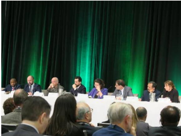
仙台防災枠組の実現にむけた WHO と WADEM のパネル