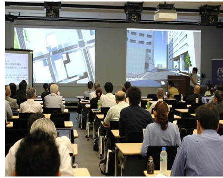
口頭発表会場の様子