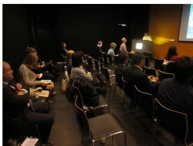
口頭発表セッション会場の様子