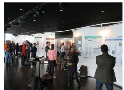
ポスター発表会場の様子