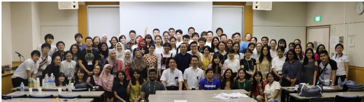
参加者との集合写真