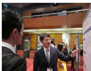
ポスター発表(寅屋敷助教)