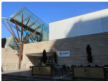
カンファレンス会場

Tetsuya Torayashiki: Analysis of Change in Industrial Structure in Areas Affected by the Great East Japan Earthquake