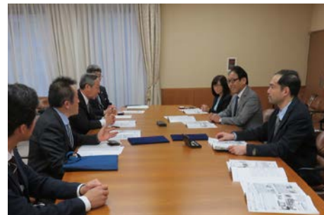
調印式での今後の事業計画についての 打ち合わせの様子