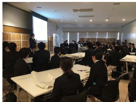
ワークショップの様子（1）