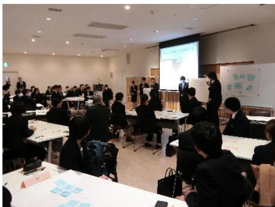
ワークショップ様子（発表）