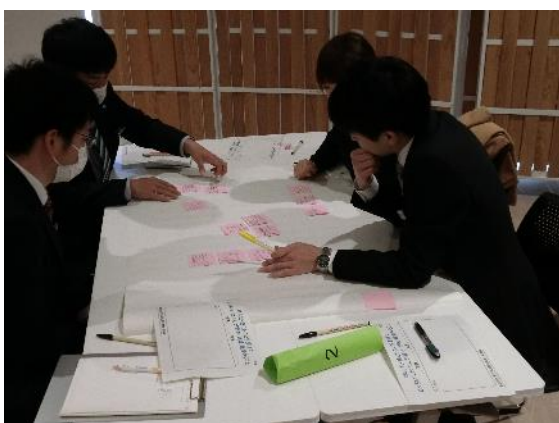
ワークショップの様子（2）