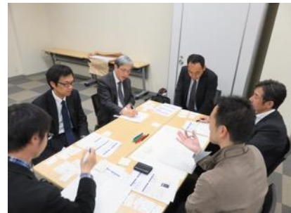
課題について話し合う参加者