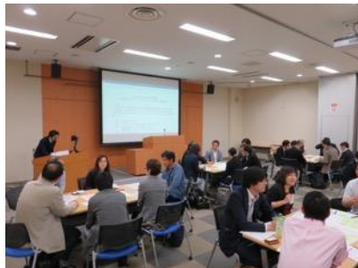
グループワーク開始