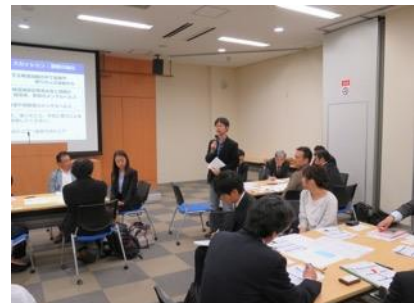
グループの意見を発表する