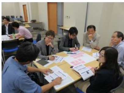
業種を越えて頭を悩ませる