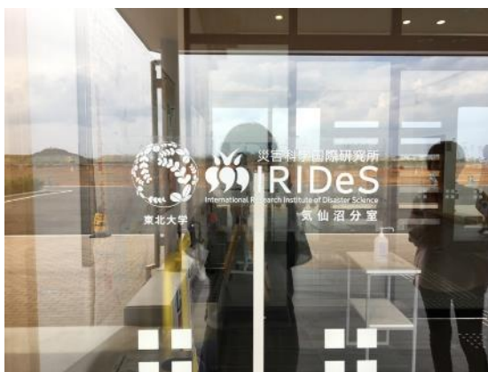
入り口・分室の表札