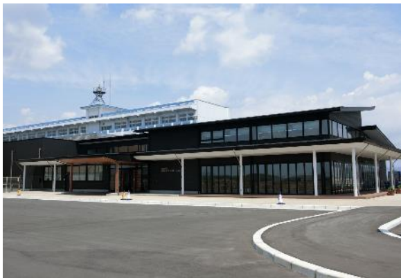
気仙沼市 東日本大震災遺構・伝承館