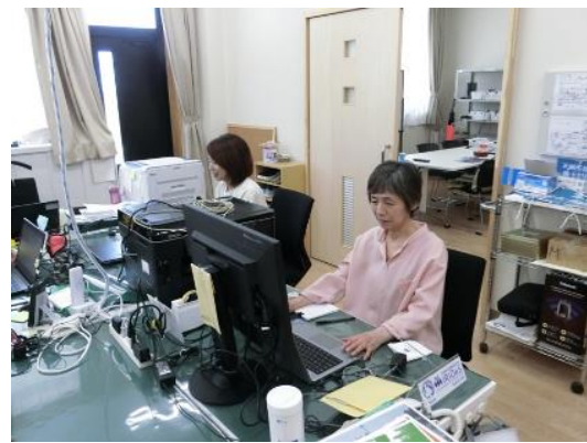
新しい分室の執務スペース