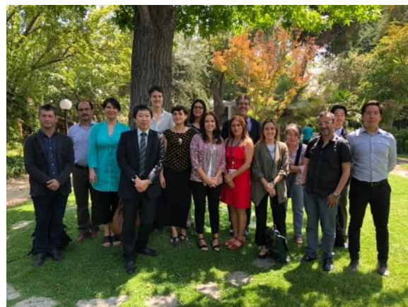
カトリカ大学関係者