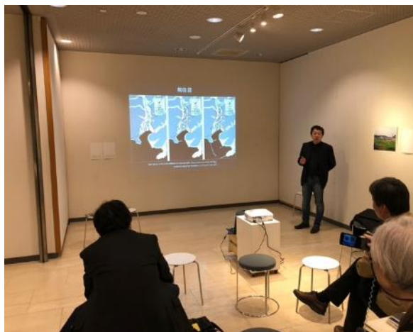
トークショーの様子