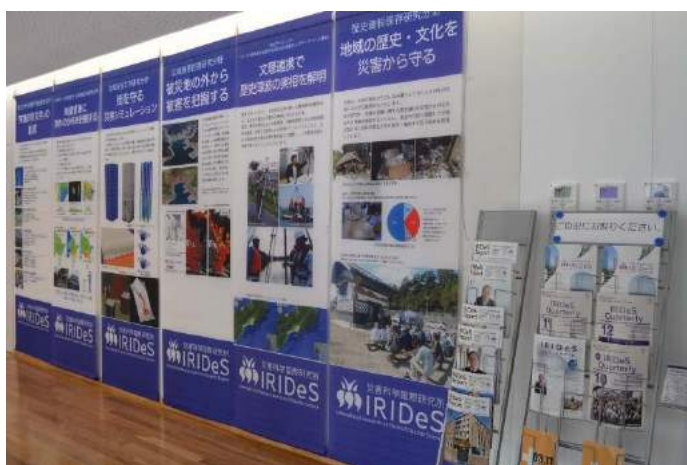
災害研2F 展示スペースのポスター。研究のトピックスを展示しています。