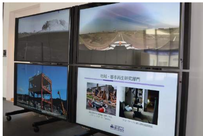
1F エントランスホールの大型モニター。アーカイブ映像等を見ることができます。