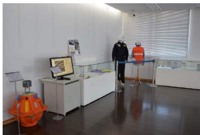
災害研2F 展示スペース。災害調査や災害研究に関する展示を行っています。

見学会では、研究者が展示について詳しく説明を行います。 3D映画も体験できます。