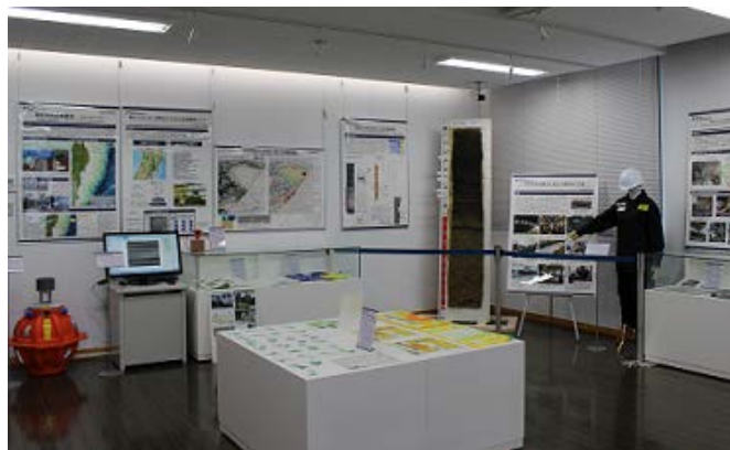
災害研2F展示スペース。災害調査や災害研究に関する展示を行っています。