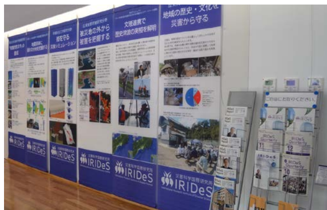
見学ツアーでは3D映画も視聴いただけます。