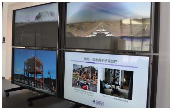
1F エントランスホールの大型モニター。アーカイブ映像等を見ることができます。