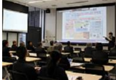
① 多主体ゲーミング シミュレーションシステム