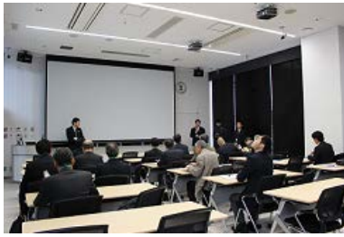
災害科学国際研究所の紹介