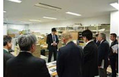
② 地域歴史資料の災害対策