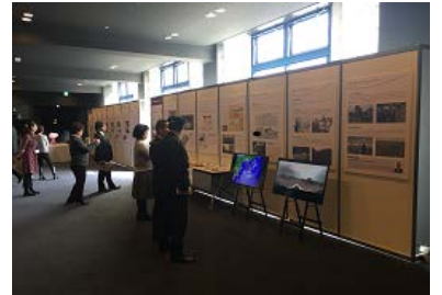
萩ホールでの展示の様子