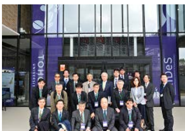
参加者による集合写真