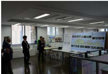
③ 2011年東日本大震災から 見えてきたこと