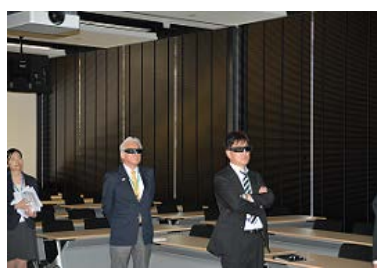
⑥ 災害科学情報の多次元統合 可視化システム