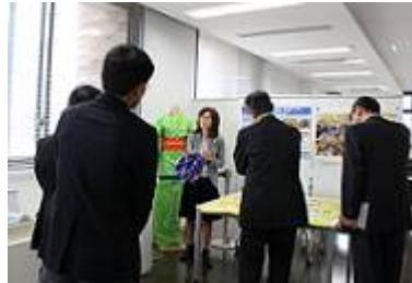
④ 減災「結」プロジェクト