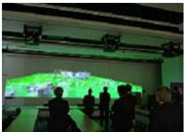
⑥ 災害科学情報の多次元統合 可視化システム