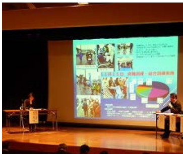
セッションI：モデレーター (桜井准教授)