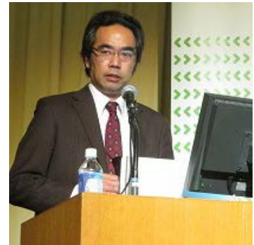
セッションC：報告 (平野准教授)