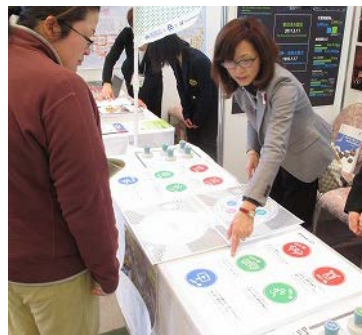
スタンプラリーの様子