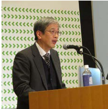
セッションC：コーディネーター (丸谷教授)