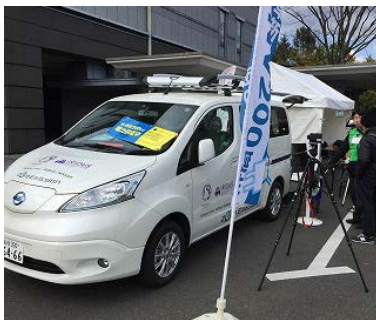
電気自動車（EV）展示の様子