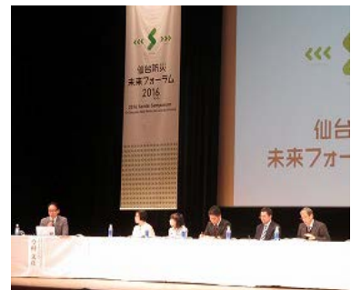
クロージング：コーディネーター (今村所長)