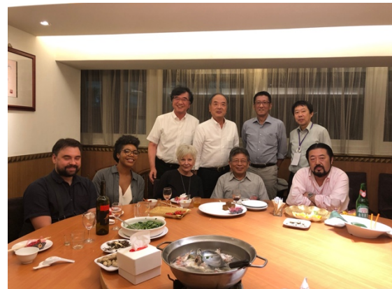
次回 ICUDR に向けて日米台の各学会の理事らと