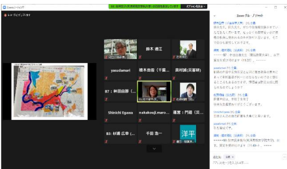
発表および質疑応答の様子 2 (チャット欄での質疑も盛り上がっています)