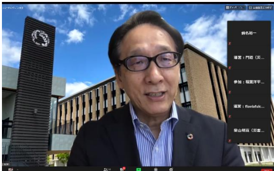
今村所長による開会挨拶の様子

https://irides.tohoku.ac.jp/research/project_area-unit/