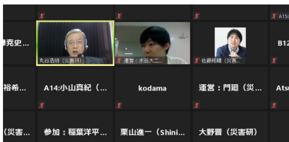
丸谷副所長による閉会挨拶の様子