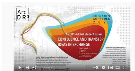
ArcDR3 学生交流フォーラム メインスクリーン