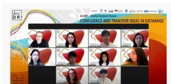
学生同士の質疑応答