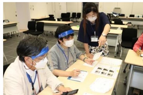
災害時に集まってくる多数の 情報処理、伝達に四苦八苦