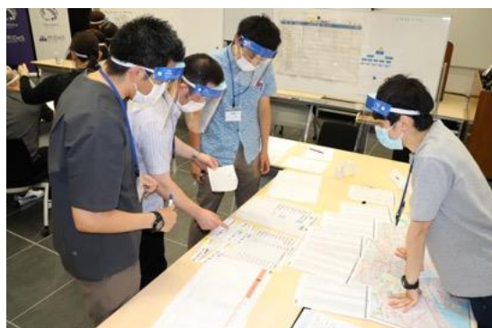
地図、避難所情報、医療資源を 勘案し巡回医療チームを配分