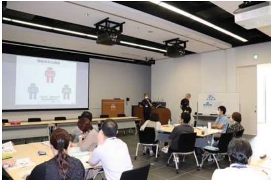
研修スペースを広く使って

昨年度に引き続いて、新型コロナウイルス感染症蔓延を鑑み、受講定員を大幅に削減して研修を実施しました。受講生の間隔を広くとる、換気の励行、手指消毒、マスク・フェイスシールド着用、大声を発しない会話など、感染対策に万全の注意を払いつつ研修を実施しました。