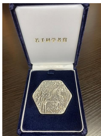
若手科学者賞の受賞記念メダル