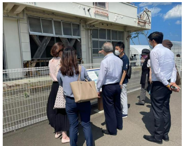
震災遺構・荒浜小学校を訪問