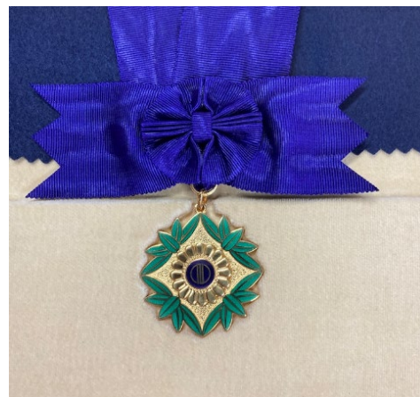
表彰状と記念メダル