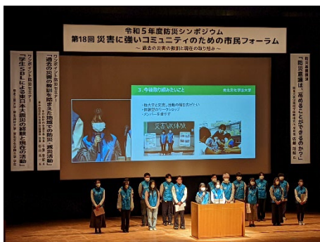
ワンポイント防災セミナー