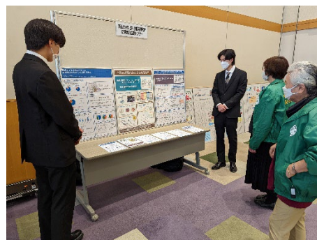
防災教育協働センターによるパネル展示