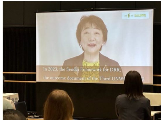
郡和子仙台市長によるビデオメッセージ