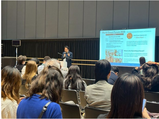
小野裕一教授によるプレゼンテーション