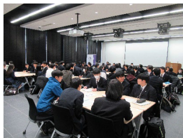
アイスブレイク（交流活動）