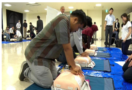
心肺蘇生法とAEDの講習会