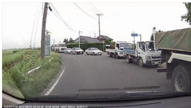
調査車両の車載カメラで記録した避難渋滞状況